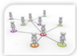
Filière gérontologique entre Bauges et lacs